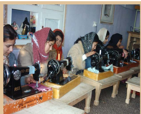
د خیاطي پروژې: د روښانه راتلونکي په هیله د بڼو مهارتونه زیاتول