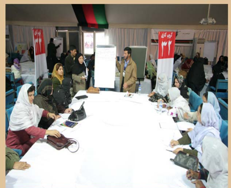
د کلیوالي پرمختیایي شورا کنفرانس: د همکاري او همغږي را منځته کول

د کلیو پراختیایي شوراګانې دنده لري چې دسيمي شته اومناېع يو موټي کړي او خپل مالي امکانات چې د ملي پيوستون پروګرام له خوا هر کلي ته ۲۷۰۰۰۰ امریکایي ډالره د پرمختیایي پلانونو لپاره مرسته کيږي په بڼه توګه ولګوي کلیوالي پرمختیایي شوراګانې ډېروژو او دکار دتولو پړاوانو مسولیت په غاړه لري کلیوال رهبري کوي تر څو پروژي په سمه توګه پلي کړي .