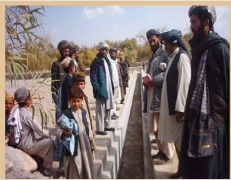
د کانال جوړولو پروژه: د زراعتي محصولاتو د کچي لوړونه