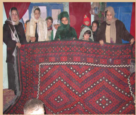
د قالينو اوبدلو پروژه: کلیوالو ښخوټه د کټي سرچینه

د ملي پيوستون پروگرام چې دافغانستان اسلامي دولت دارزښتناکو او جوړونکو کرنلارو له نظره ملي او ځانگړي پروگرام دي د (۲۰۰۳) کال په نيمايي کي پيل شو . دغه پروگرام د منځ ته راتلو راهيسي د نړيوال بانک او نړيوالي پرمختيايي ټولني له ملاتړ څخه برخمن دي ، بنسټيزه موخه يي د بيلابيلو سيمه ايزو بنسټونو د جوړولو او عملي کولو له لاري د سيمي داوسيدونکو د بيوزلي او غريبي د کچي کښته کول دي د ملي پيوستون پروگرام دافغانانو له دود او دستور سره سم وده کړي او له حشر يا ډله ايز کار ډله ايزي تصميم نيوني له دود نه په گټي اخيستي سره داسانتياو برابرولو ديوالي ، برابري او اسلامي سپيڅلوارزښتنو پر بنسټ دستونځو د اوارولو لپاره را منځته شويدي