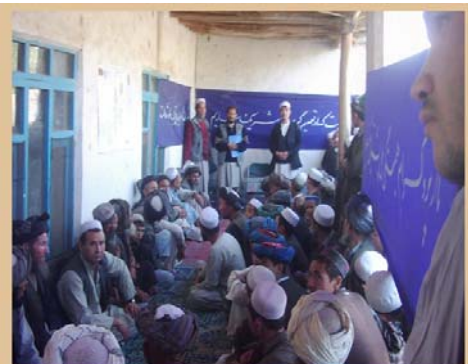
د کلیوالي پرمختيايي شورا ټاکنې: کلیوال اوسيدونکي د ټاکنو په خپلواکه بهير کي ونډه اخلي

د کلیو پراختيايي شوراگاني به د مرستندويو موسسو په مرسته دکليو هغه پرمختيايي اړتياوي چې لومړيتوب لري په گوته کړي دکليو پرمختيايي پلانونو ته به وده او پراختيا ورکړي او د کلیو له اوسيدونکو سره به يوځاي د پروژو د نوبت نه ډک پلانونه طرح او جوړ کړي .